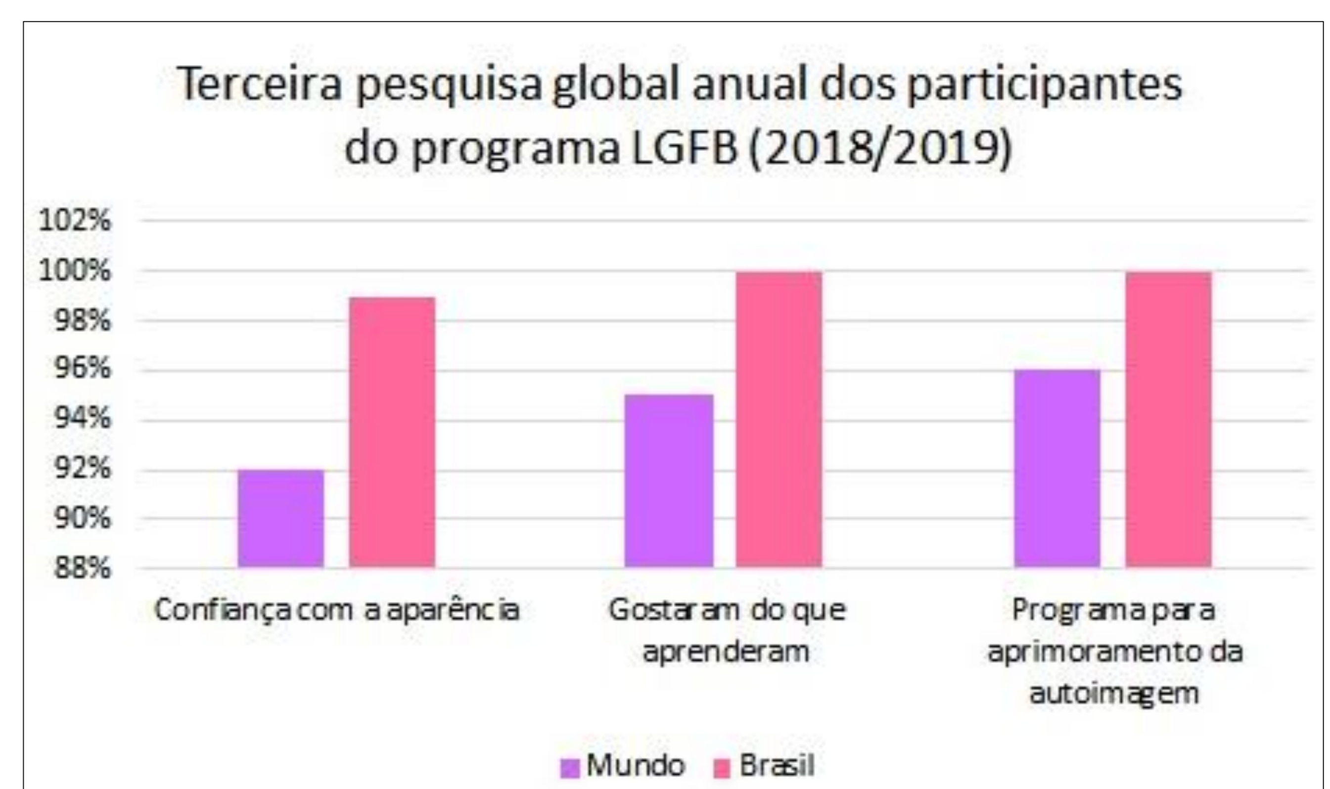
Figura 2 – Gráfico da Pesquisa Mundial do Programa LGBF