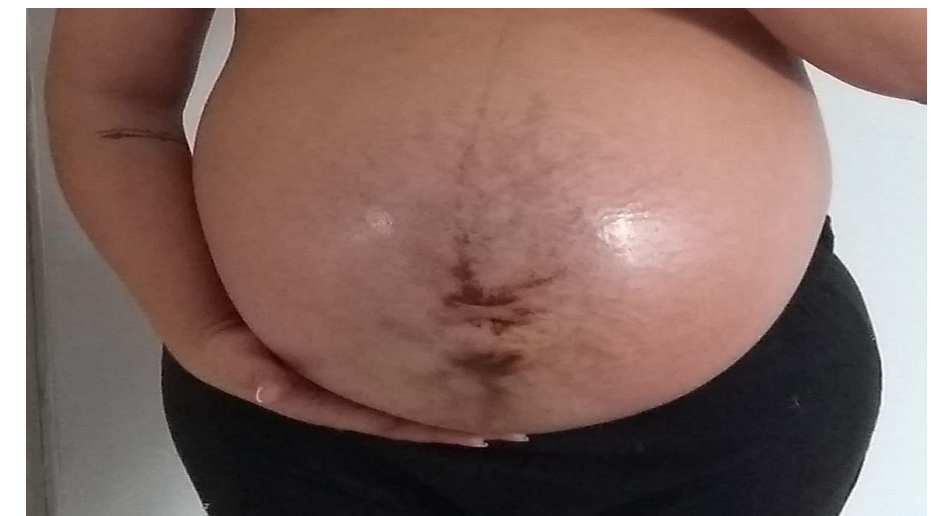
Figura 1 – Estrias na região do abdome durante a gestação

Os resultados foram obtidos através da análise qualitativa composta de investigação visual crítica e criteriosa, de 9 produtos para gestantes com o apelo antiestrias de 9 marcas diferentes. Sendo eles, 8 formulações em apresentação creme e 1 em apresentação óleo. Foram analisadas as informações de rotulagem, das embalagens (primárias e/ou secundária), na qual se avaliou apelo, marca, forma cosmética e composição. A leitura cuidadosa dos rótulos de embalagens primária e secundária dos produtos foi imprescindível para a análise crítica das composições. O uso de cremes pode ter um efeito mais significativo do que o uso dos óleos puros, pois tem a combinação de ativos e/ou substâncias que intensificam o poder de hidratação da pele.